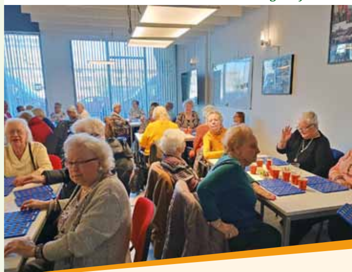
Bingo bij de BBD