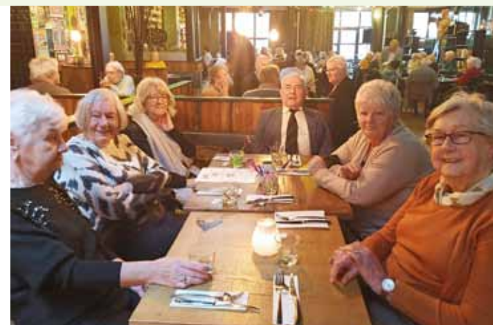
Gezellig dineren in De Prael

✓ De BBD draait door (15 en 29 april) (14.00 - 16.00 uur bij de BBD) Gezellige middag met rad van avontuur, quiz en muziek, incl. hapjes, drankjes en leuke prijzen.