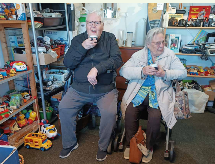
Bezoekjes aan kringloopwinkels zijn altijd populair

Op 1 april wordt de bevrijding van Den Briel nagespeeld