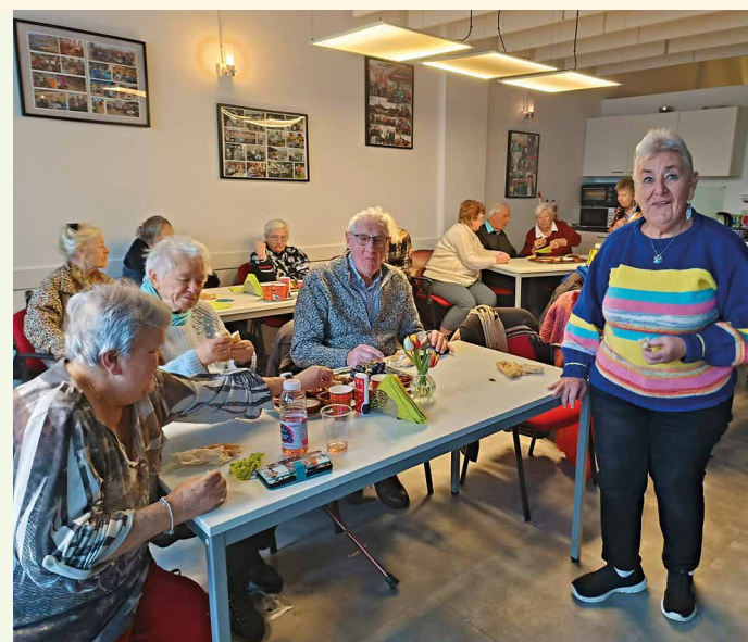
Er is bijna iedere dag van de week wel iets gezelligs te doen bij de BBD

BBD-prijs € 12,50 / Ooievaarspasprijs € 6,25