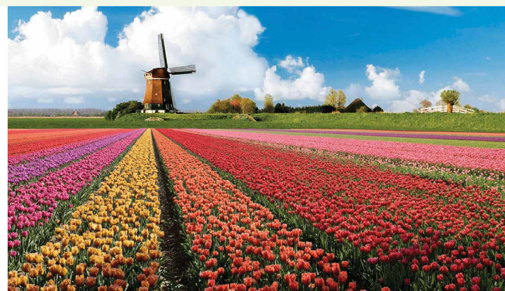
De bollentocht, altijd weer een hoogtepunt in het jaar

Nog even op het busje wachten na het winkelen