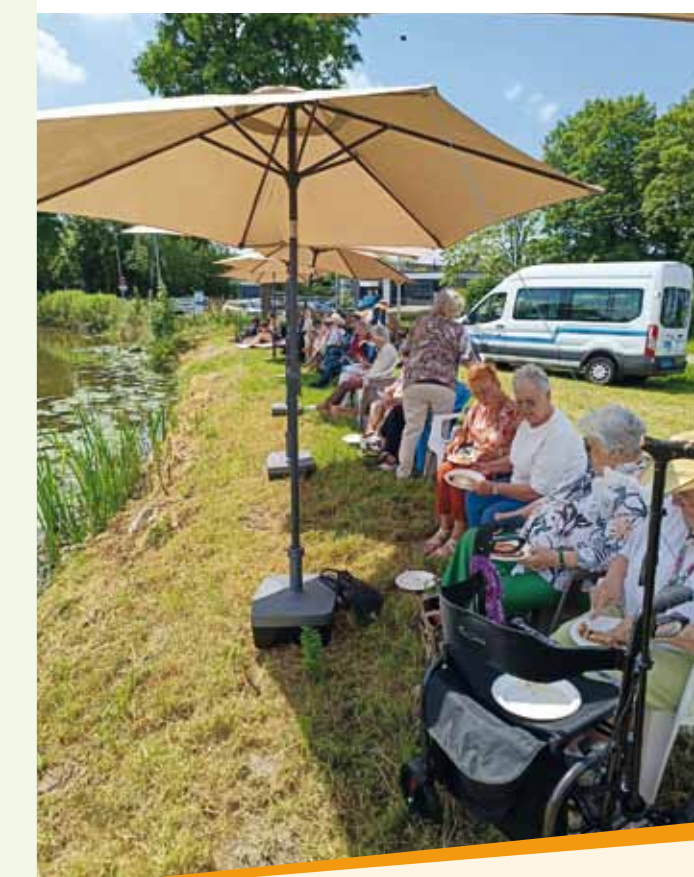
Wat zitten ze daar leuk aan de waterkant