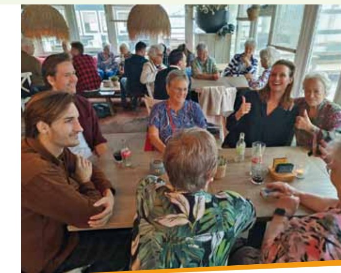
Stranduitje AevesBenefit 2023

BBD-prijs € 19,50 / Ooievaarspasprijs € 9,75