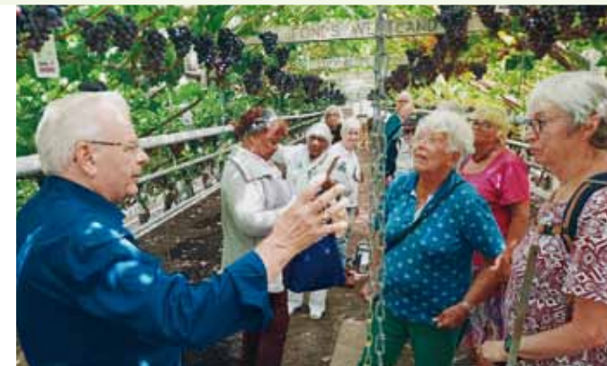
Bezoek druivenkwekerij 2022

BBD-prijs € 9,50 / Ooievaarspasprijs € 4,75