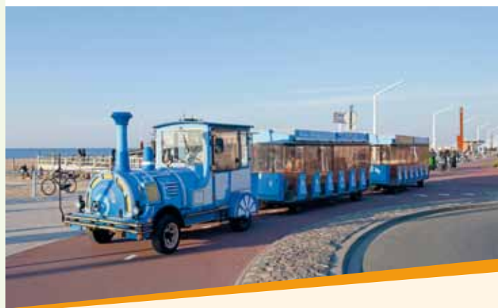
Boulevardtrein Scheveningen (31 augustus)

BBD-prijs € 24,50 (inclusief lunchpakket)