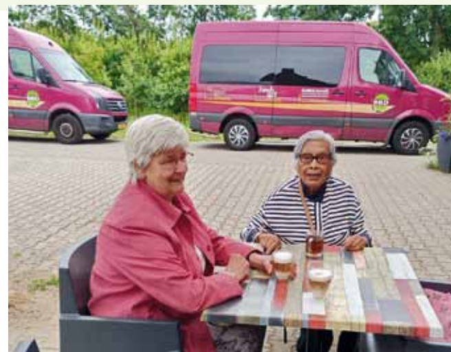
Het BBD-busje wacht geduldig tot de koffie op is

BBD-prijs € 15,- (inclusief entree, spel en koffie / thee of frisdrank)