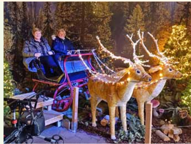
Bezoek aan een tuincentrum in kerstseer

✓ Winkelen in Zoetermeer (10.00 uur) Vandaag gaan we een dagje winkelen in Het Stadshart in Zoetermeer. BBD-Prijs € 12,50 / Ooievaarsprijis € 6,25