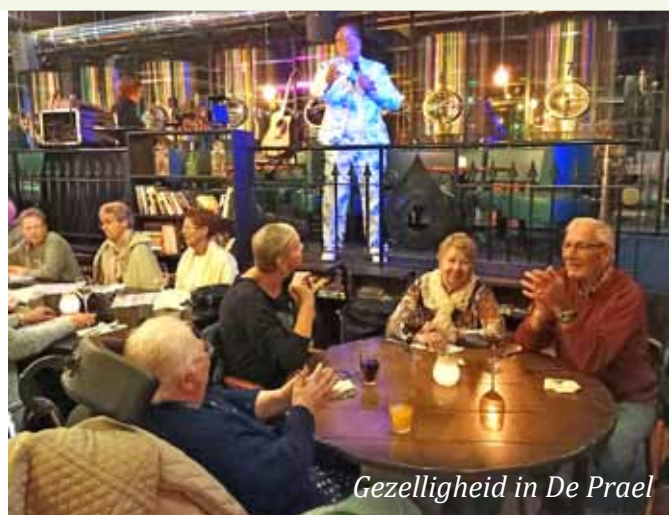
Gezelligheid in De Prael

BBD-prijs € 15,- / Ooievaarspasprijs € 7,50 (inclusief hapje en drankje en bingo)