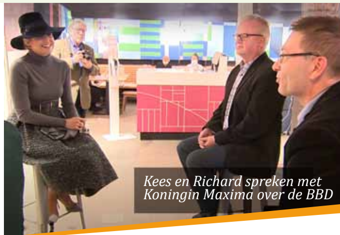
Kees en Richard spreken met Koningin Maxima over de BBD

✓ Westfield mall of the Netherlands (12.00 uur) Voorheen heette het Leidschenhage en nu heeft het de onmogelijke naam 'Westfield mall of the Netherlands', maar het is wel een mooi nieuw winkelcentrum met honderden winkels met alles wat een mens nodig kan hebben. BBD-prijs € 8,- / Ooievaarsprijis € 4,-