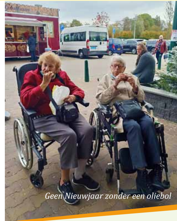
Geen Nieuwjaar zonder een oliebol

Wie niet zelf mee kan om boodschappen te doen, kan een beroep doen op onze bezorgdienst.