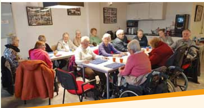
Bingo bij de BBD

Gezellige middag met rad van avontuur, quiz en muziek, incl. hapjes, drankje en leuke prijzen.