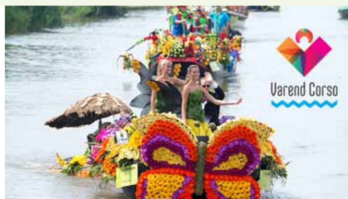
Het varend corso komt dit jaar door Den Haag

✓ BBD-Soos met koffie / thee en hapjes (14.00 uur - 16.00 uur bij de BBD) 8 en 22 juni: Kien met Catherien De bingo-variant met 90 ballen. De eerste ronde is gratis, daarna € 0,50 per ronde. 15 juni: Knutselen