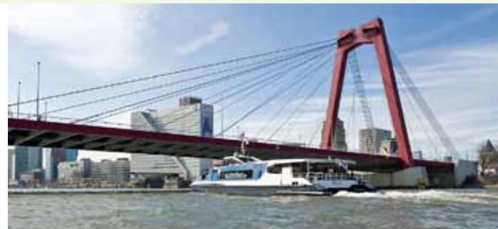
De Waterbus van Rotterdam naar Dordrecht

✓ Antiek- en Brocantemarkt in Delft (11.00 uur) Vandaag gaan we lekker scharrelen over de leukste antiek- en brocantemarkt van Nederland langs de kraampjes aan de mooie grachten van Delft. Gezellige terrasjes volop!! BBD-prijs € 15,- / Ooievaarspasprijs € 7,50