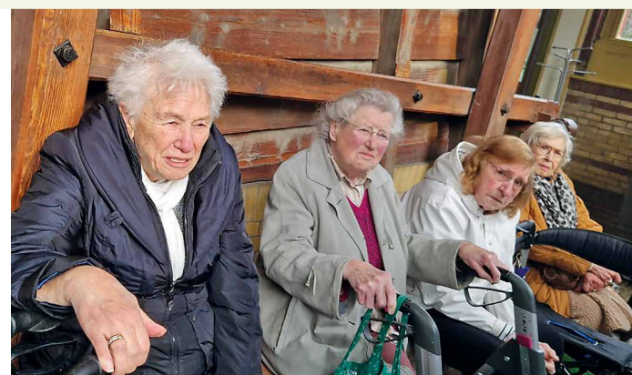
Even bijkomen, straks weer verder

BBD-prijs € 29,50 (inclusief demonstratie en koffie / thee)