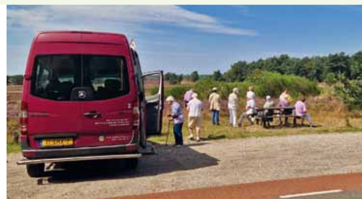
Een tocht langs de heidevelden op een stralende dag

✓ Eten in café New Jorissen (17.00 uur) We gaan lekker eten in dit gezellige café in de Heelsumstraat. De prijs is € 12,50 (inclusief 2 drankjes) BBD-prijs € 12,50 / Ooievaarsprijis € 6,25 (exclusief eten en drinken)