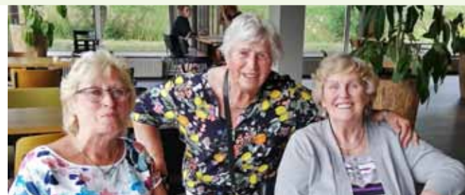
uitstapje juli 2021

✓ Tuincentrum de Bosrand (11.00 uur) We bezoeken dit nieuwe tuincentrum in Oegstgeest waar een restaurant en alles voor huis, tuin en dier en nog veel meer te vinden is. BBD-prijs € 15,- / Ooievaarspasprijs € 7,50