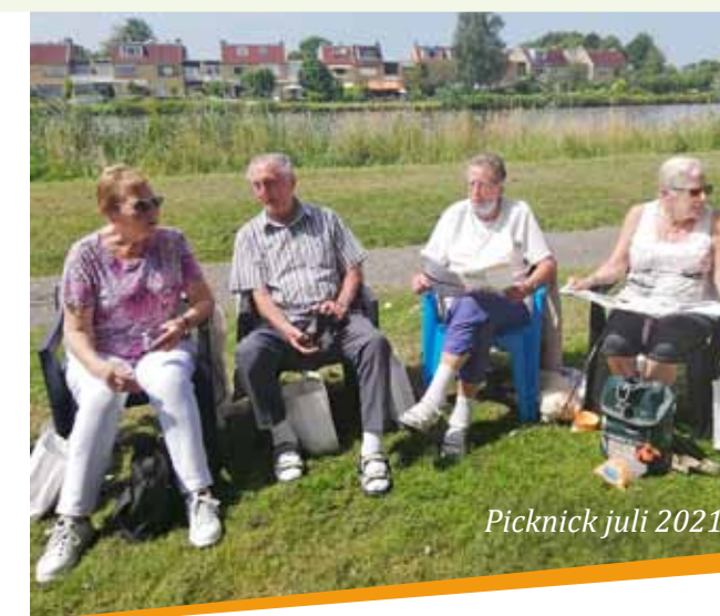
Picknick juli 2021

✓ Pannenkoeken Meyendel (11.00 uur) De eigenaar van boerderij Meyendel trakteert BBD-klanten eenmaal per maand op een pannenkoek of een broodje naar keuze met twee drankjes. Dit wordt kosteloos aangeboden! BBD-prijs € 8,- / Ooievaarspasprijs € 4,- (inclusief pannenkoek of broodje en 2 drankjes)